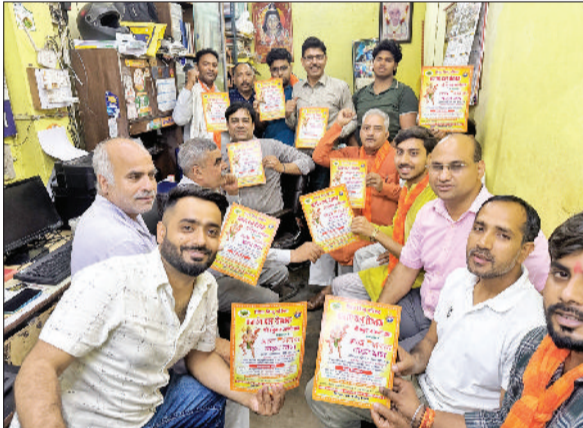
रोहतक। शोभा यात्रा के लिए निमंत्रण देते विहिप व बजरंग दल के सदस्य।

विश्व हिंदू परिषद और बजरंग दल के तत्वावधान में इस वर्ष हनुमान जन्मोत्सव के उपलक्ष्य में शहर में एक विशाल धार्मिक आयोजन किया जा रहा है। 3 अप्रैल को आयोजित होने वाली इस भव्य वाहन यात्रा को लेकर पूरे शहर में भारी उत्साह है। आयोजकों के अनुसार, इस यात्रा में 500 से अधिक दोपहिया और चार पहिया वाहनों के साथ हजारों श्रद्धालुओं के शामिल होने की संभावना है।