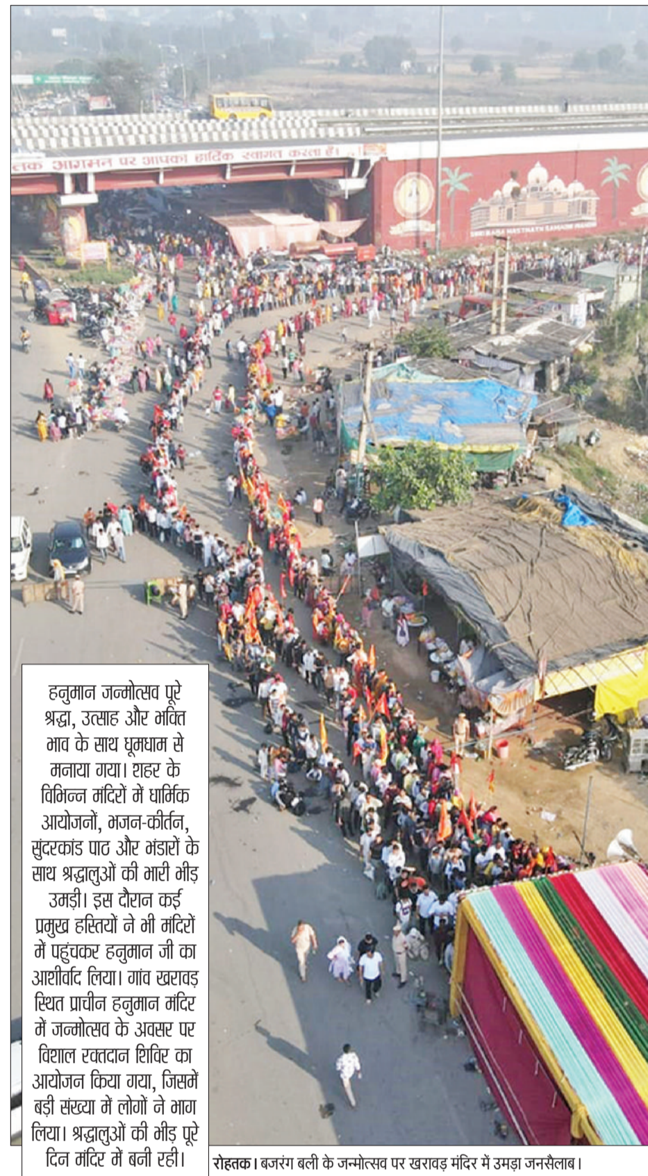
रोहतक। बजरंग बली के जन्मोत्सव पर खरावड़ मंदिर में उमड़ा जनसैलाब।