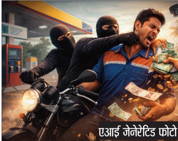
एआई जेनेरेटिव फोटो