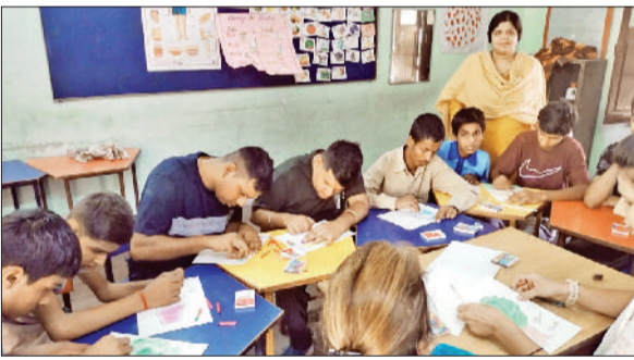
रोहतक। ब्रह्मंड और ब्लॉक की गतिविधियों में भाग लेते बच्चे।

संघ कार्यालय पर संपन्न होगी। पूरे शहर में भगवा ध्वज और स्वागत द्वारों से सजावट की जा रही है। सुरक्षा के दृष्टिगत स्थानीय प्रशासन और पुलिस बल भी मुस्तेद है ताकि यातायात व्यवस्था सुचारू रहे। विहिप और बजरंग दल के कार्यकर्ताओं ने इस यात्रा में भाग लेने की अपील की है। समापन पर सतों के आशीर्चन और प्रसाद वितरण का भी प्रबंध किया गया है।