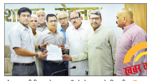
रोहतक। सीटीएम को ज्ञापन सौंपते सेक्टर 3 के निवासी।

आरोप लगाया कि पॉलीविलिनिक क्षेत्र सहित सेक्टर-3 की कुल 14 सड़कें आज तक नहीं बनाई गई हैं, जबकि इस संबंध में कई बार शिकायतें की जा चुकी हैं। स्थानीय लोगों का कहना है कि पिछले लगभग दस वर्षों से सड़क निर्माण का कोई काम नहीं हुआ है, जिससे क्षेत्रवासियों को भारी परेशानियों का सामना करना पड़ रहा है। ठेकेदार ने केवल चार सड़कों का ही निर्माण किया है।